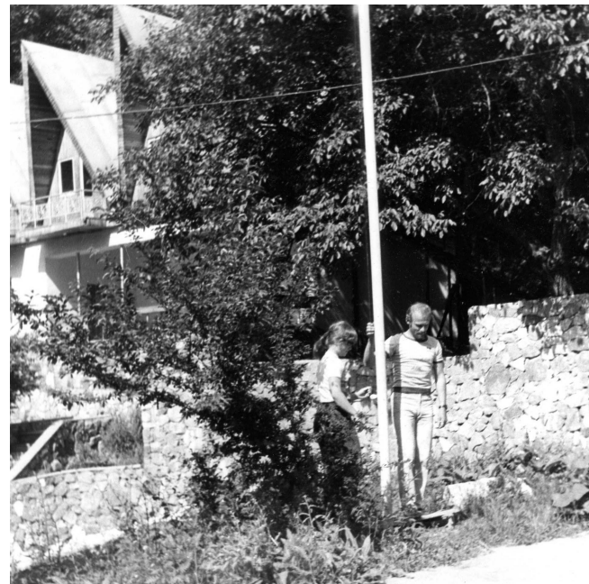
Первый русский альпинист, ступивший на вершину Эвереста, Владимир Сергеевич Балыбердин открывает сезон восхождений в альпинистском лагере Варзоб (Памиро-Алай). Снимок 1985 года.