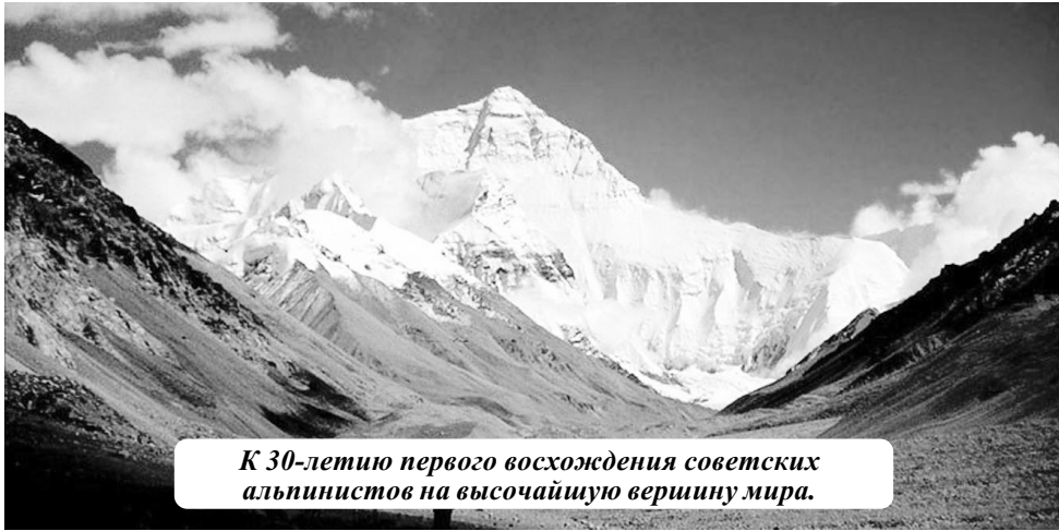
К 30-летию первого восхождения советских альпинистов на высочайшую вершину мира.